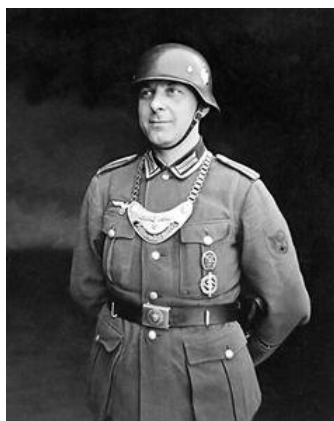
Soldat allemand en faction devant l'entrée de la Kommandantur, au 7 Boulevard Clémenceau