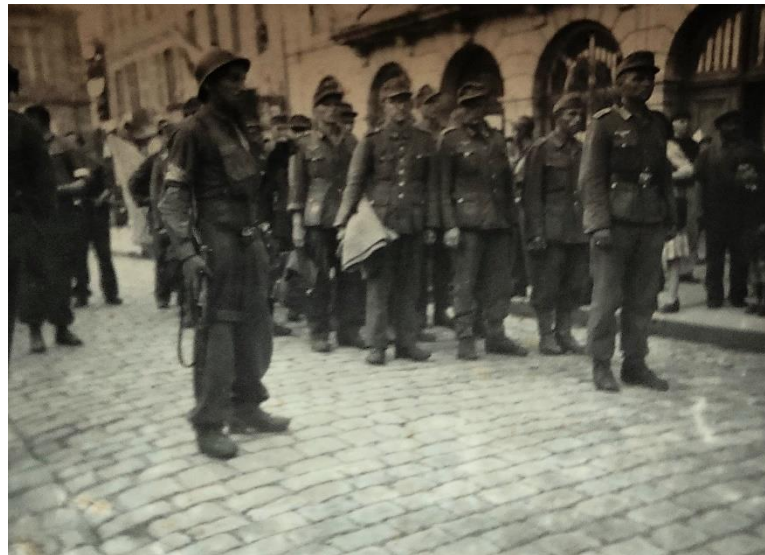
Soldats allemands sous la garde des maquisards

Les combats durent depuis des heures et l'occupant a décroché, se repliant vers Saint-Michel où, pris à revers par les maquisards descendant de Grâce par la rue de la Madeleine il finit par se rendre remplissant bientôt la place Saint-Michel, les bras en l'air. Pourtant le canon tonne encore, stupéfaction : on tire sur le clocher ! L'abbé Kermaïdic va très vite planter un drapeau tricolore en haut de la tour de l'horloge mais peut-il être vu et par qui ?