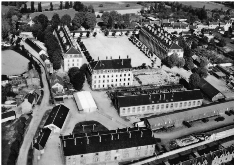
Caserne La Tour d'Auvergne au lendemain de la Libération