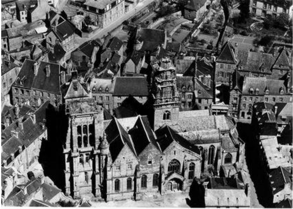
Basilique Notre-Dame de Bon Secours en 1954

Photos et cartes postales : J. D. et J.-P. Rolland