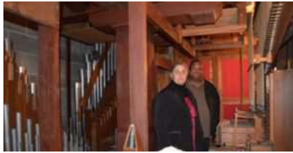
Vue sur les mécanismes complexes des grands orgues de Guingamp dont les parties les plus anciennes datent de 1646.

Ces 20 000 € de dons à ces trois projets entrent complètement dans l'orientation de l'Année européenne des compétences en participant au financement de travaux en cours et à venir sur des éléments patrimoniaux et donc en participant à la préservation de savoir-faire et de compétences traditionnels.