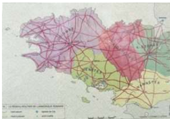
Les Osismes, un puissant peuple celtique dont la culture a laissé des traces : poterie à Pabu, statue du barde à la lyre à Paule, et monnaies celtiques sur l'ensemble du territoire et ailleurs.