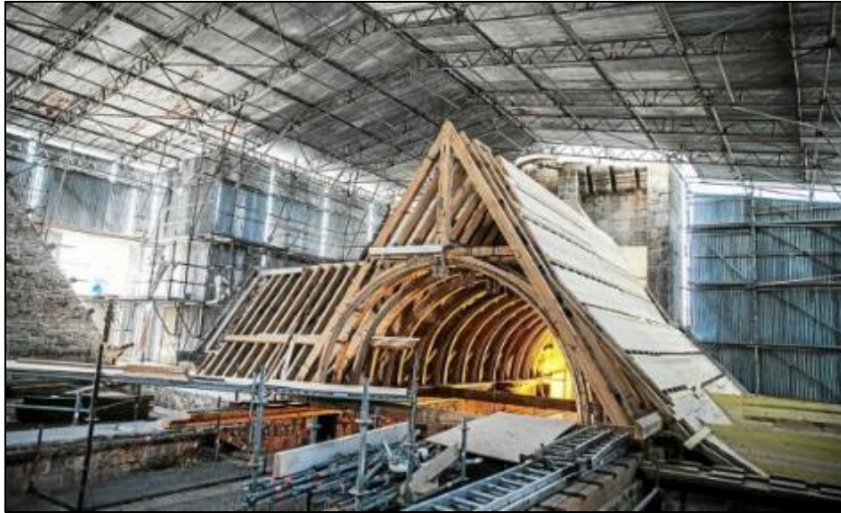
Travaux de reconstruction de la charpente – Cliché Lionel Le Saux/Le Télégramme

Nous avons également participé à la Marche Bleue organisée par la résidence Kersalic le dimanche 2 octobre. Ce cru 2022 rassemblait une petite centaine de personnes âgées. Etaient également présents des jeunes venus avec l'Ordre de Malte pour prêter main-forte aux anciens.